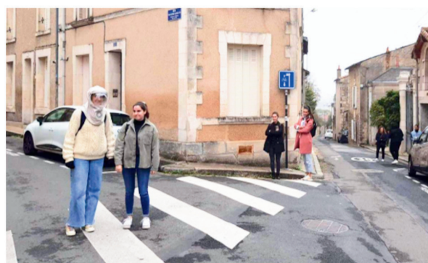
Importance des réactions en fonction des situations

Le rideau 1 représente la famille et les personnes qui marchent à côté du XP, le rideau 2 représente la famille ou les personnes qui marchent à quelques mètres derrière le XP. En effet les personnes réagissent souvent après avoir croisé le XP.